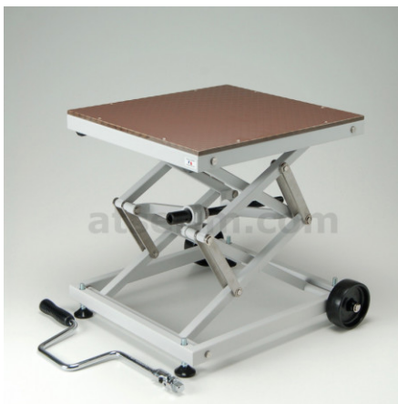
TABLE ELEVATRICE 404M

Table élévatrice TE404M , faible encombrement pour une capacité de charge allant jusqu'à 100 kg en charge statique. Hauteur de 140 à 540 mm.