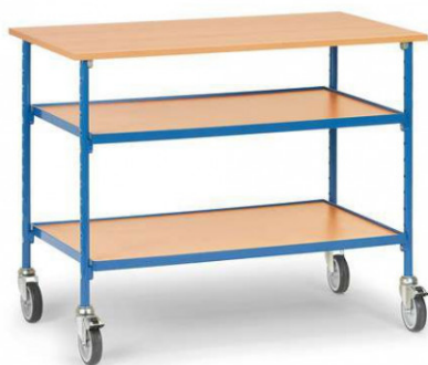
Table roulante à 3 plateaux