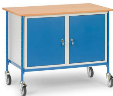
Table roulante avec 2 placards